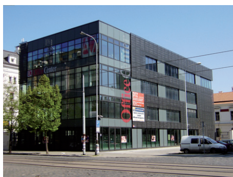
Office centrum A7, Holešovický pivovar, Praha 7 - Holešovice