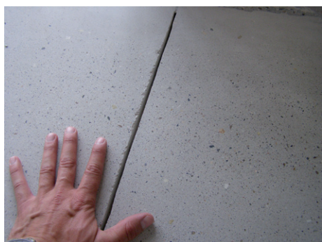
CemFlow s přebroušeným povrchem

Litý cementový potěr CemFlow je jiný. Díky unikátní receptuře je objemově stálý, s maximální hodnotou smrštění 0,5 mm/m, při zachování vysoké tekutosti směsi. Zjednodušeně řečeno, CemFlow v sobě spojuje aplikační výhody Anhymentu s výhodami cementových výrobků.