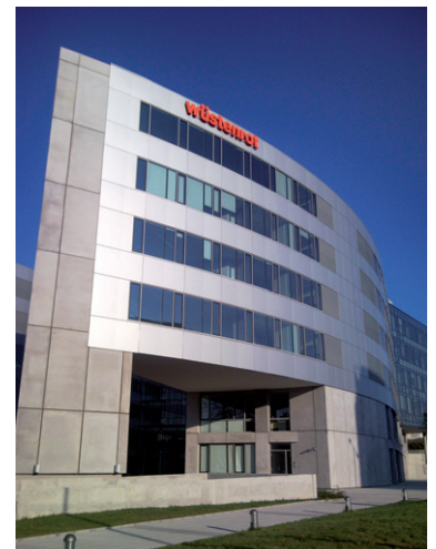
Kavčí Hory Office Park, Praha 4 - Nusle