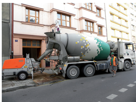
Doprava a čerpání