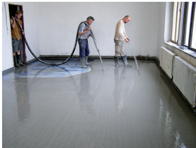
CemFlow, jednoduchý proces aplikace směsi

Rohanské nábřeží 68, 186 00 Praha 8 tel.: 728 173 893, fax: 222 324 492 e-mail: jakub.simacek@tbg-beton.cz, www.tbg-prazskemalty.cz