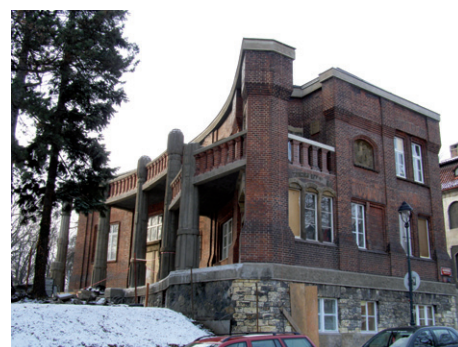
Bílková vila, Praha 6 - Hradčany