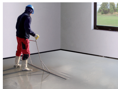
CemFlow, zpracování tekuté směsi