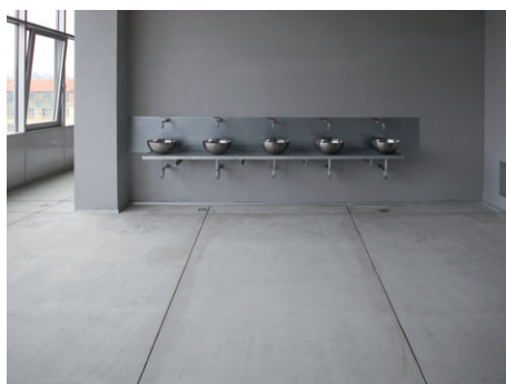
CemFlow, možnost použití i do vlhkých prostor